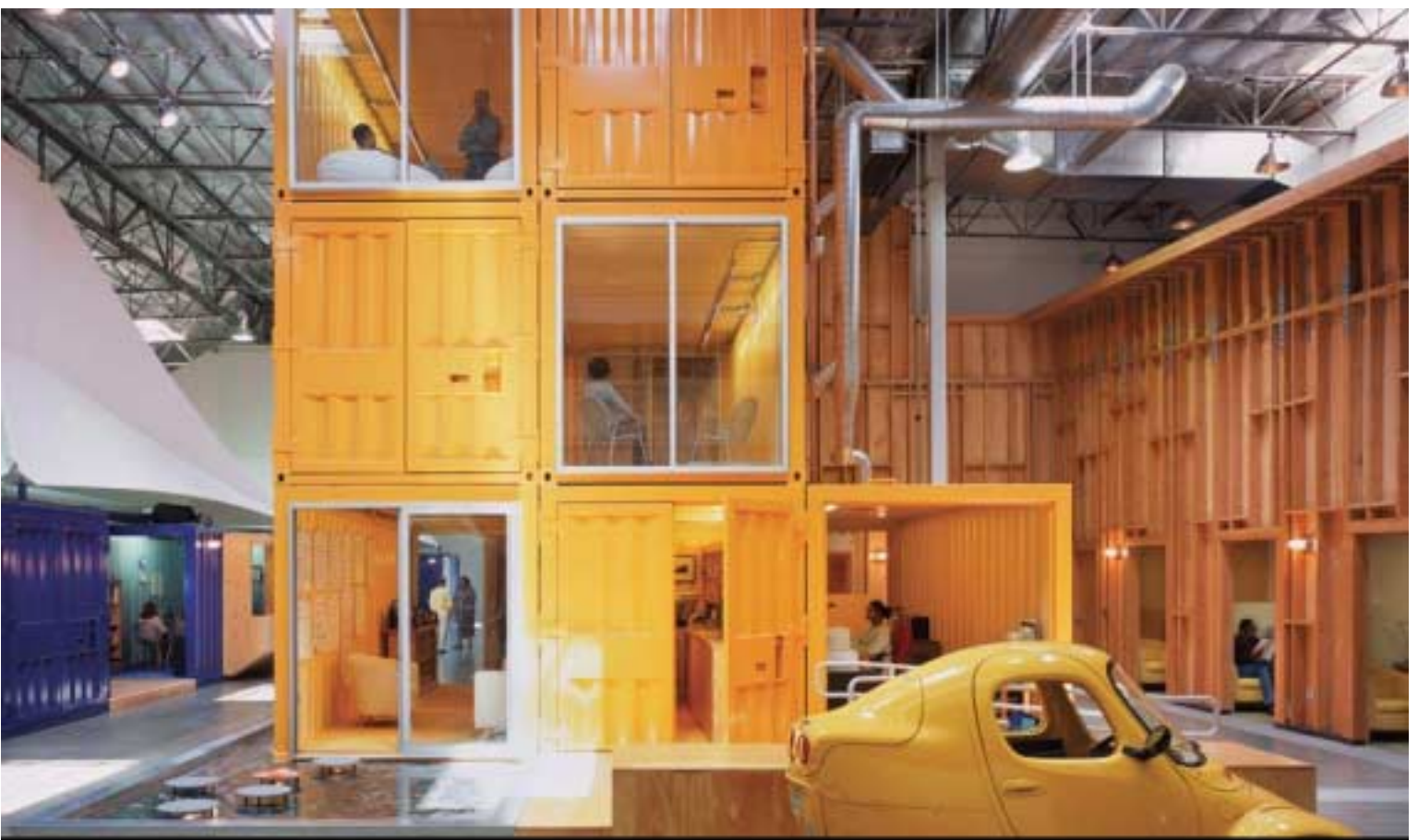
מטה Pollatto Teamworks

חברת העיצוב הדנית Bosch & Fjord עיצבה עבור Lego את מרכז העצבים והפיתוח של החברה בדנמרק. חלל מחלקת הפיתוח עוצב כחללים פתוחים ודינאמיים כדי לעודד אינטראקציה בין העובדים מוצרים ומחשבות.