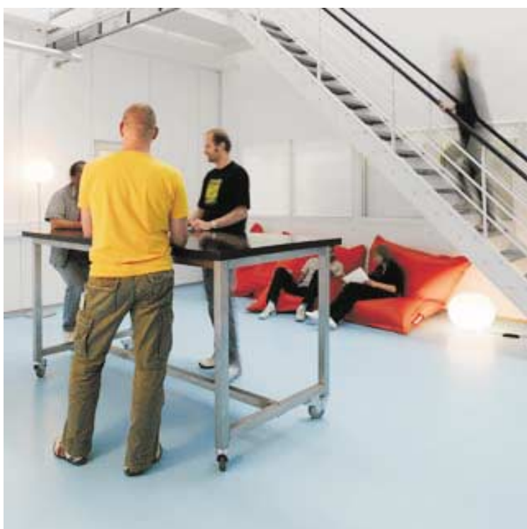
מטה Lego , דנמרק

חדר ישיבות "פיקניק" עם פופים גדולים לסיעור מוחות וחשיבה משותפת, חדר ישיבות "אואזיס" לאתנחתא באמצע יום עמוס, חלל פתוח עם רהיטים על גלגלים לישיבות קצרות והחלפת מידע, וחדר ישיבות עם שעון גדול על הקיר לישיבות קצרות וממוקדות.