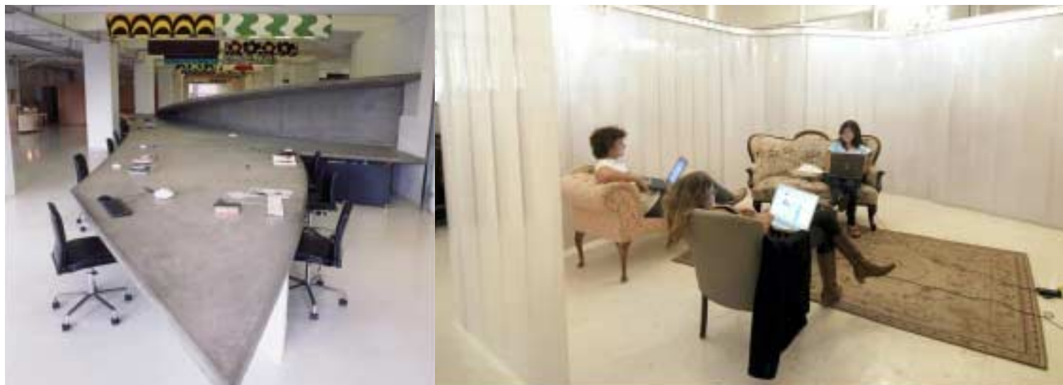
משרדי חברת הפרסום MOTHER

לא רק חברות פרסום נדרשות להפיק עבודת פיתוח קריאטיבית ואסטרטגית, גם חברת Google פנתה אליהם בבקשה לעצב עבורה את מטה הפיתוח של החברה בעמק הסיליקון קליפורניה. המשרדים עוצבו כמגרש משחקים אחד גדול. שילוב של חללים פתוחים וסגורים, בצבעים קורנים ועליזים, עם משטחי דשא מלאכותי כחדר ישיבות לסיעור מוחות ופינות ישיבה משתנות.