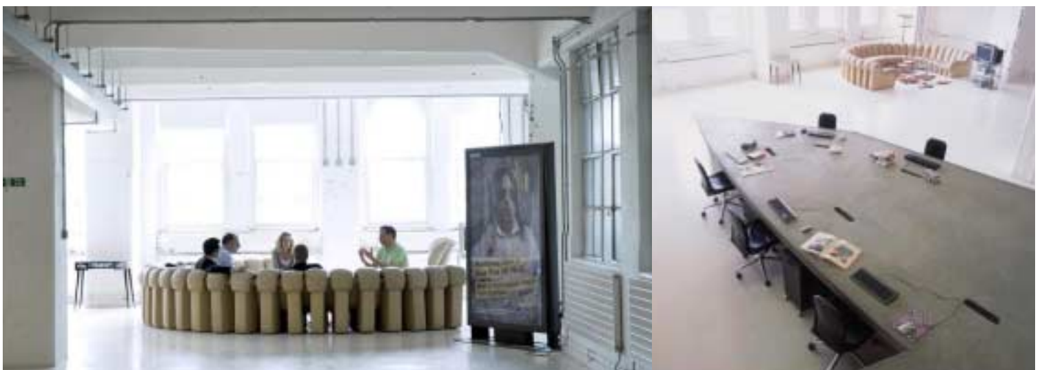
משרדי חברת הפרסום MOTHER, לונדון