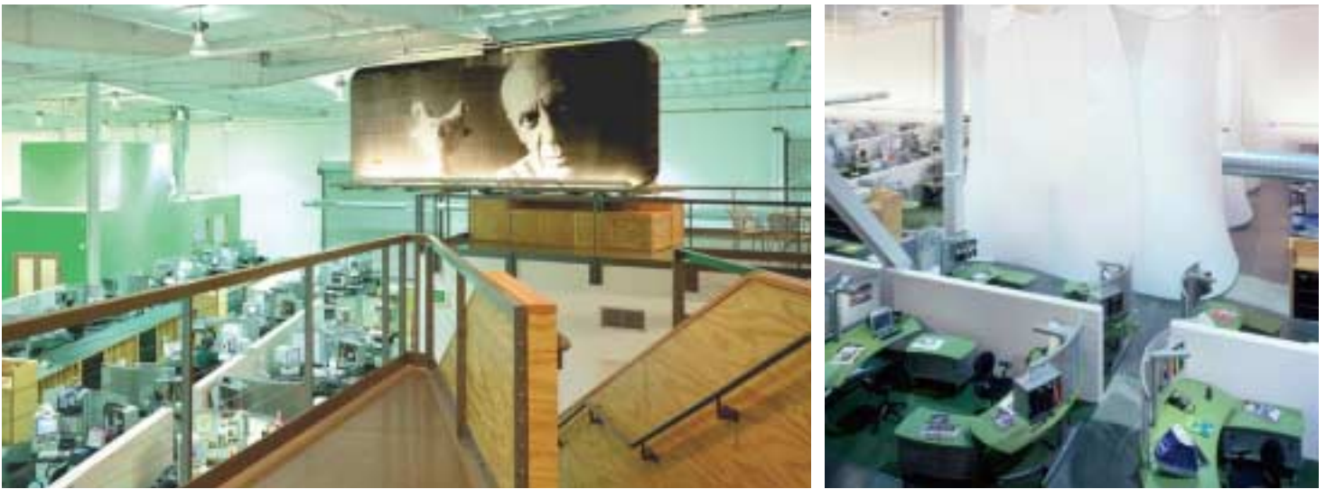
משרדי חברת הפרסום TBWA, לוס אנג'לס

משרד הארכיטקטים עיצב Clive Wilkinson Architects כבר ב1998 את משרדי TBWA בלוס אנג'לס, בפרוייקט שזכה לכינוי "Advertising City". הפרוייקט מכנס את כל עובדי החברה לקהילה קריאטיבית אחת, וכולל "רחוב ראשי", "סנטרל פארק" עם פינות ישיבה, מגרש כדורסל, שלטי חוצות, שכונת עבודה ומבנים נוספים לישיבות וחללי עבודה.