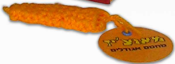
עיצוב מארז לבסטות כורסא "מאנצ'יז" הכולל שתייה, נשנושים ומחמם אגודלים