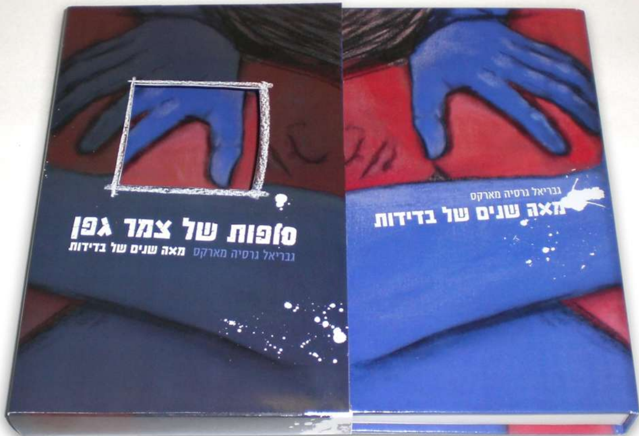
עיצוב כריכה ומארז לספר "מאה שנים של בדידות" (ציור+עיצוב)