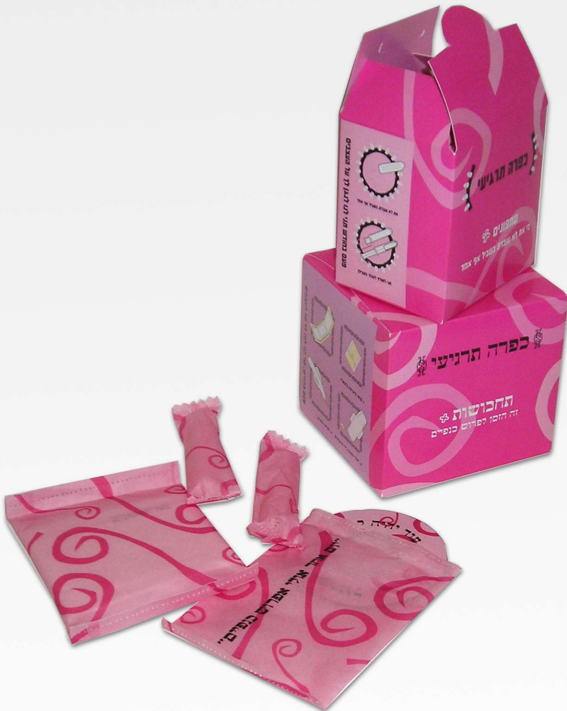
“כפרה תרגיעי” מוצרי היגיינה נשית + שיר במתנה.